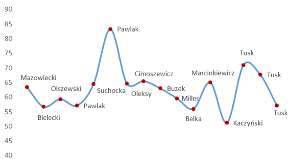
Wykres 3. Wartości pozytywne