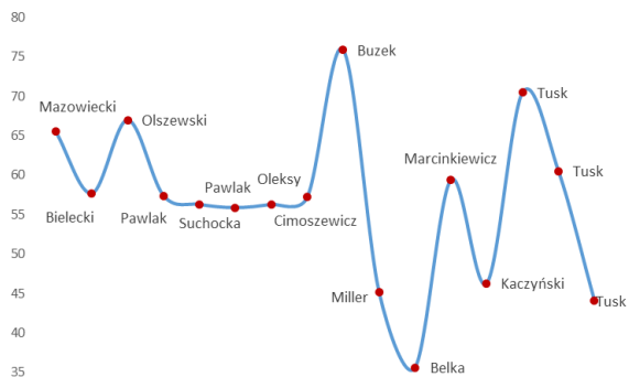
Wykres 1. Polskie symbole kolektywne