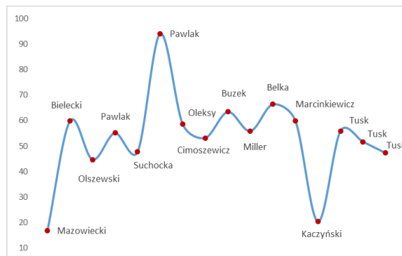
Wykres 2. Narracja menedżerska